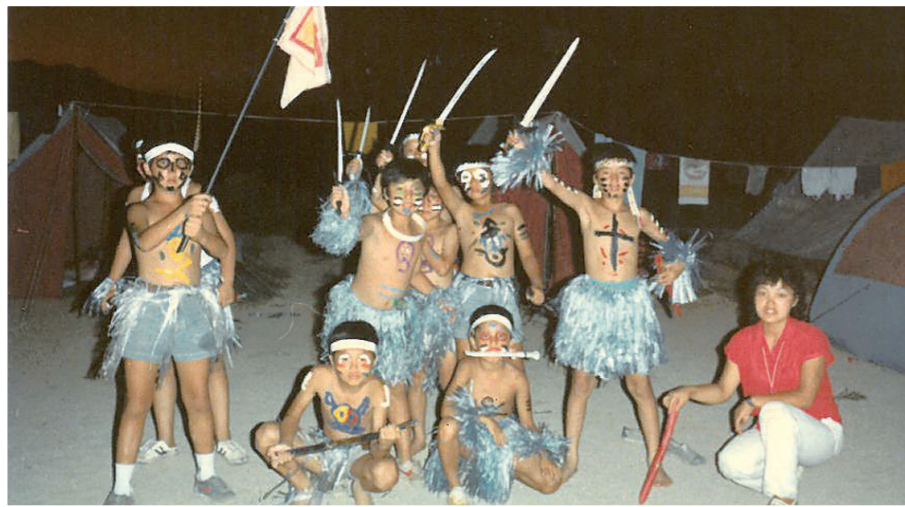
제1회 대구YWCA 어린이 캠프(1983. 8. 4 ~ 6)