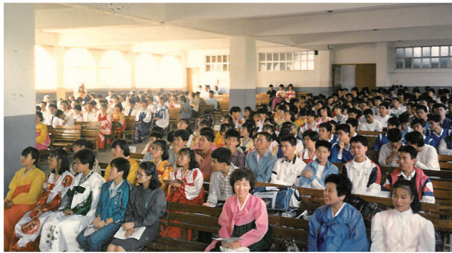
청소년 달맞이 축제(1987. 9. 19)